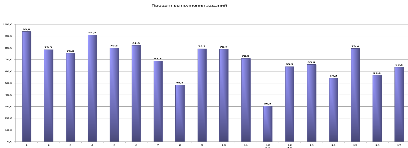
Диаграмма 2. Средний процент выполнения заданий

Как видно из диаграммы 1, подавляющее большинство учащихся, писавших диагностическую работу (90,4%), преодолели порог успешности; 9,6% учащихся получили оценку «2», т.е. на сегодняшний день эти выпускники к экзамену не готовы.